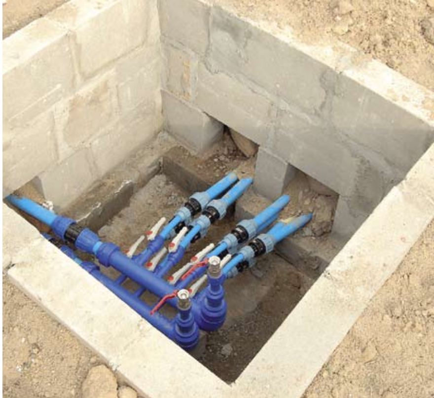
▲ We wszystkich opisanych w artykule przypadkach sondy pionowe doprowadzone są do murowanej studzienki zbiorczej, która jest połączona z pompą ciepła w budynku

Kotłownia w Raciążu jest włączona w system monitoringu Danfossa i praktycznie w każdej chwili można obserwować jej pracę. Z danych, jakie można w ten sposób uzyskać, wynika jasno, że w kolejnym sezonie grzewczym koszty eksploatacyjne jeszcze spadną, co widać chociażby po zmniejszonej liczbie godzin pracy urządzenia. (m.ż.) ■