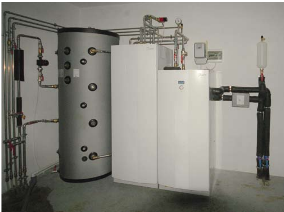
▼ Mrocza. Od lewej strony stoją: zbiornik buforowy (500 litrów), zbiornik ciepłej wody użytkowej (300 litrów) oraz pompa ciepła Danfoss DHP-L o mocy 16 kW

solidnie ocieplonego domu o powierzchni użytkowej 130 m 2 (typowa jednopiętrowa „kostka” z płaskim dachem), zbudowano drugi podobny budynek mieszkalny o nieco większym metrażu. Często spotykany rodzaj inwestycji, kiedy to dzieci budują w pobliżu rodziców. Pierwszy dom ogrzewany był od lat kotłem na olej opałowy.