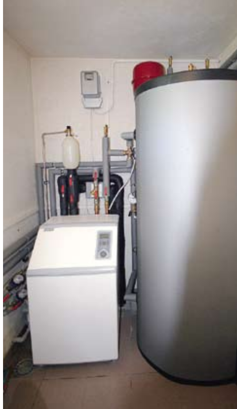
▲ Myślęcinek. Pompa ciepła Nibe Fighter 1140 o mocy 15 kW i 500-litrowy zbiornik buforowy zabezpieczający instalację i będący magazynem ciepłej wody do celów grzewczych

po zainstalowaniu pompy ciepła, spadną one do 500 złotych. To naprawdę niewiele, tym bardziej że jakość ocieplenia w ścianie trójwarstwowej i dachu budzi poważne wątpliwości. Jestem umówiony z inwestorami, że kiedy nastaną chłodniejsze dni, wykonam badanie domu kamerą termowizyjną, aby zlokalizować ewentualne błędy wykonawcze. Wprawdzie jesteśmy pewni, że budynek będzie dobrze dogrzany, ale chcemy, aby inwestor mógł osiągnąć ten efekt jak najniższym kosztem eksploatacyjnym.