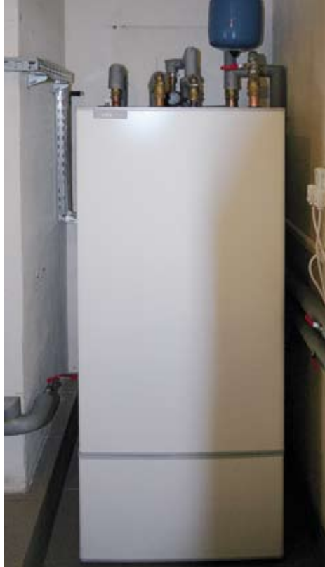
▲ Zbiornik ciepłej wody użytkowej o pojemności 200 litrów, zainstalowany w Myślęcinku

– Budynek powstał 4 lata temu – mówi Agnieszka, właścicielka domu w Myślęcinku. – Zamontowany został wówczas kocioł zasilany gazem płynnym ze zbiornika zakopanego w ogrodzie. Muszę powiedzieć, że wydawaliśmy na ogrzewanie majątek. Aby nie martwić się o zimę, trzeba było zatankować za ponad 10 tysięcy złotych. Rocznie było to już 15 tysięcy! Prawdziwy koszmar! Obecnie na gorącą wodę wydajemy około 1 złotego na dobę. Wstępne próby ogrzewania, jakie przeprowadziliśmy, pokazały, że temperatury w domu rozkładają się bardziej równomiernie niż w przypadku ogrzewania kotłem na gaz,