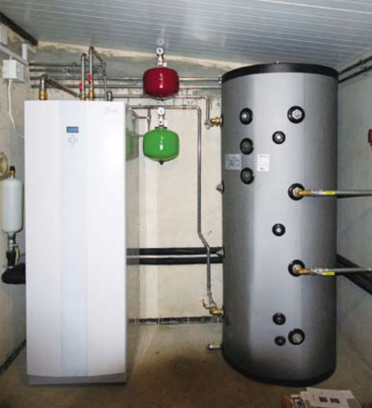
▲ Raciąż. Pompa ciepła DHP-H produkcji firmy Danfoss o mocy 16 kW, która jest zintegrowana ze zbiornikiem c.w.u. o pojemności 180 litrów

energii elektrycznej dla dwóch sąsiadujących domów (łącznie ok. 300 m 2 ) wynosiły około 800 złotych na dwa miesiące. Warto podkreślić, że kolejna zima powinna być dla inwestora jeszcze tańsza, ponieważ poprzednio jeden z budynków był świeżo oddany do użytku i dopiero „wygrzewał się”, a to podnosi koszty nawet o 40%!